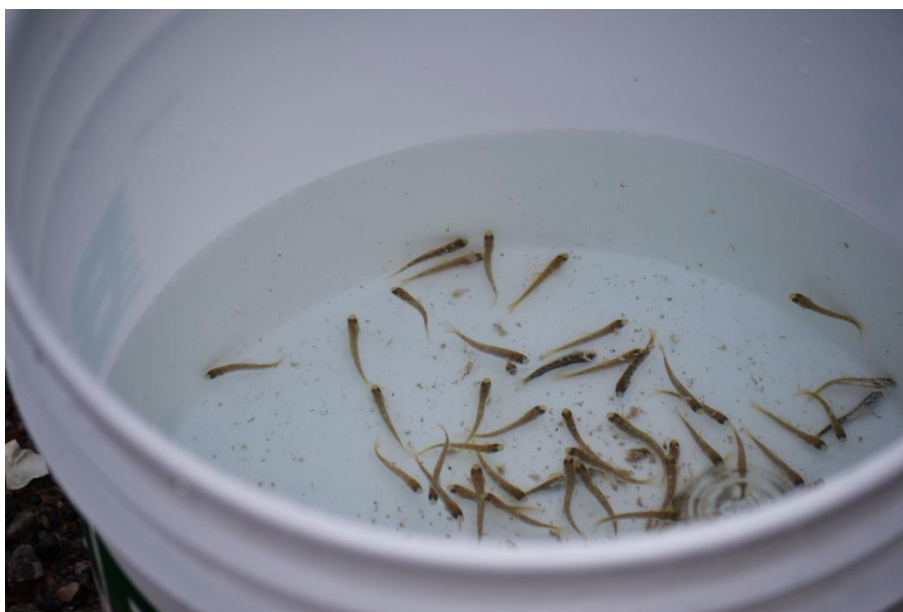
Chaudière avec des alevins lors d'une activité de remise à l'eau.

Merci à tous les élèves, professeurs et bénévoles pour avoir participé à ce beau projet collectif.